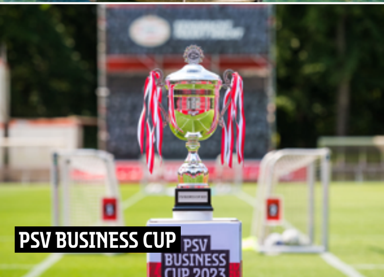
PSV BUSINESS CUP