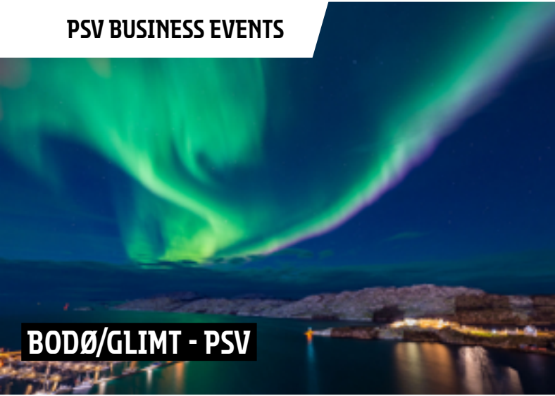
PSV BUSINESS EVENTS