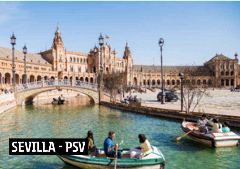
SEVILLA - PSV