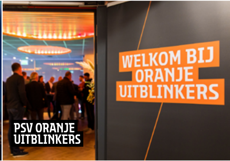
PSV ORANJE UITBLINKERS