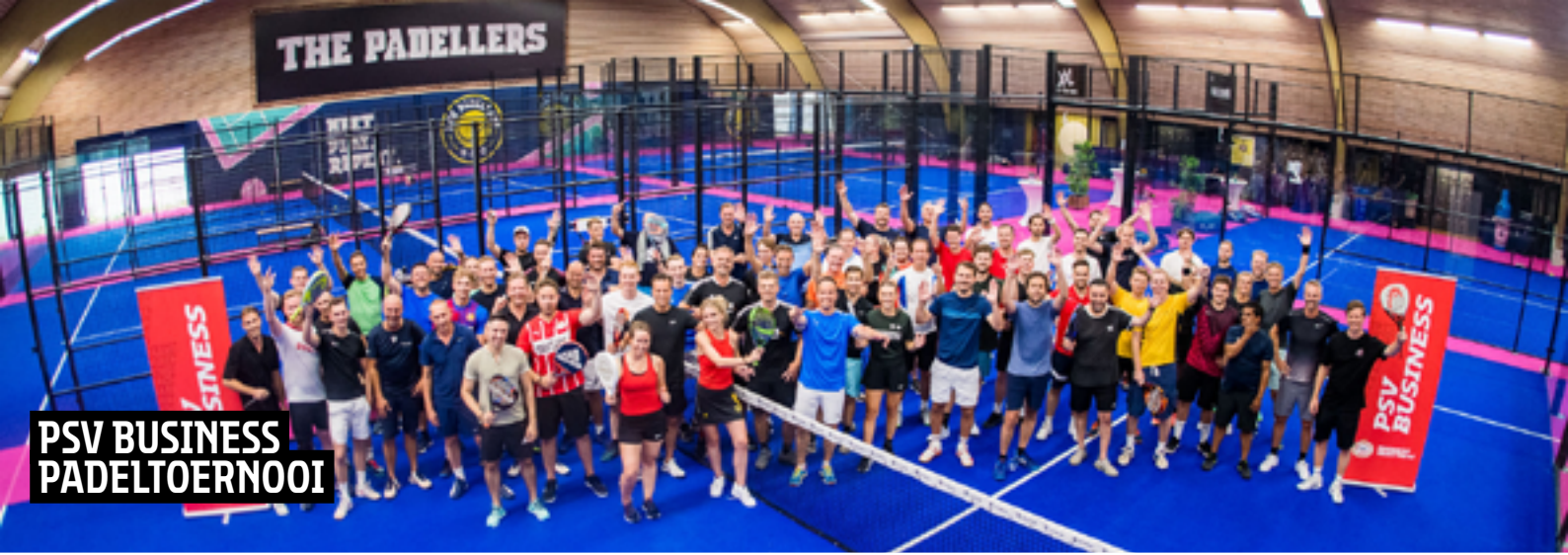
PSV BUSINESS PADELTOERNOOI