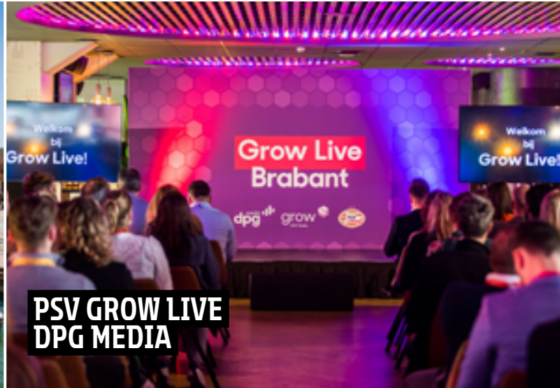
PSV GROW LIVE DPG MEDIA