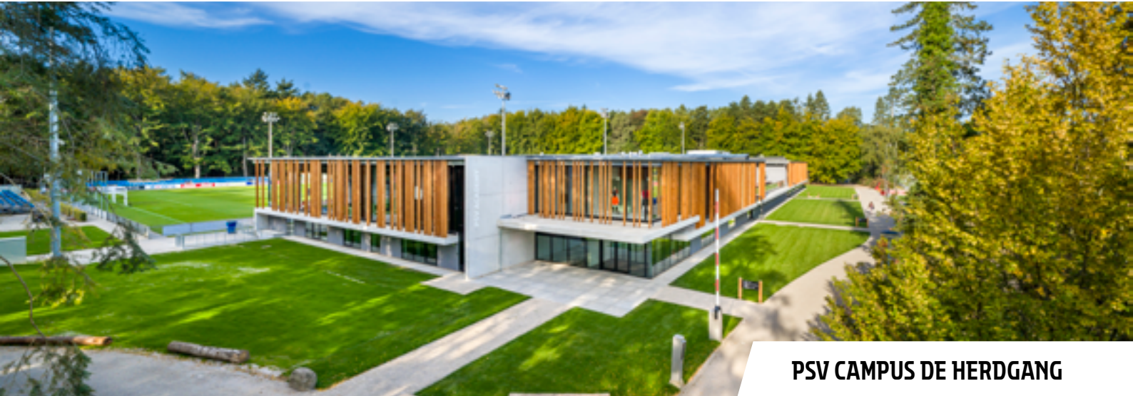
PSV CAMPUS DE HERDANG